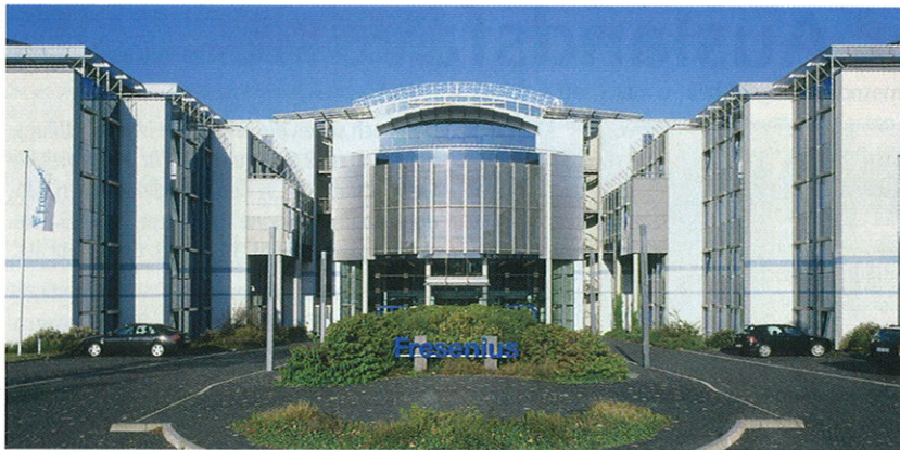
Fresenius Medical Care